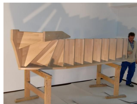
Freiwange auf Stufen setzen