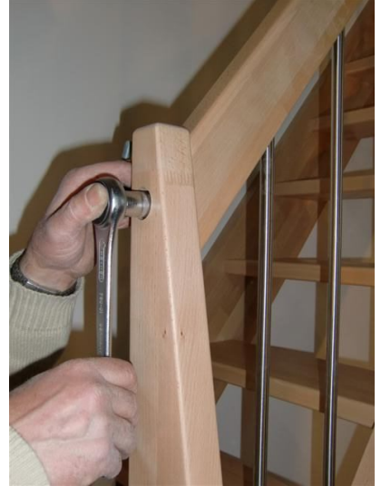
Verbindung T4, Pfosten/Handlauf